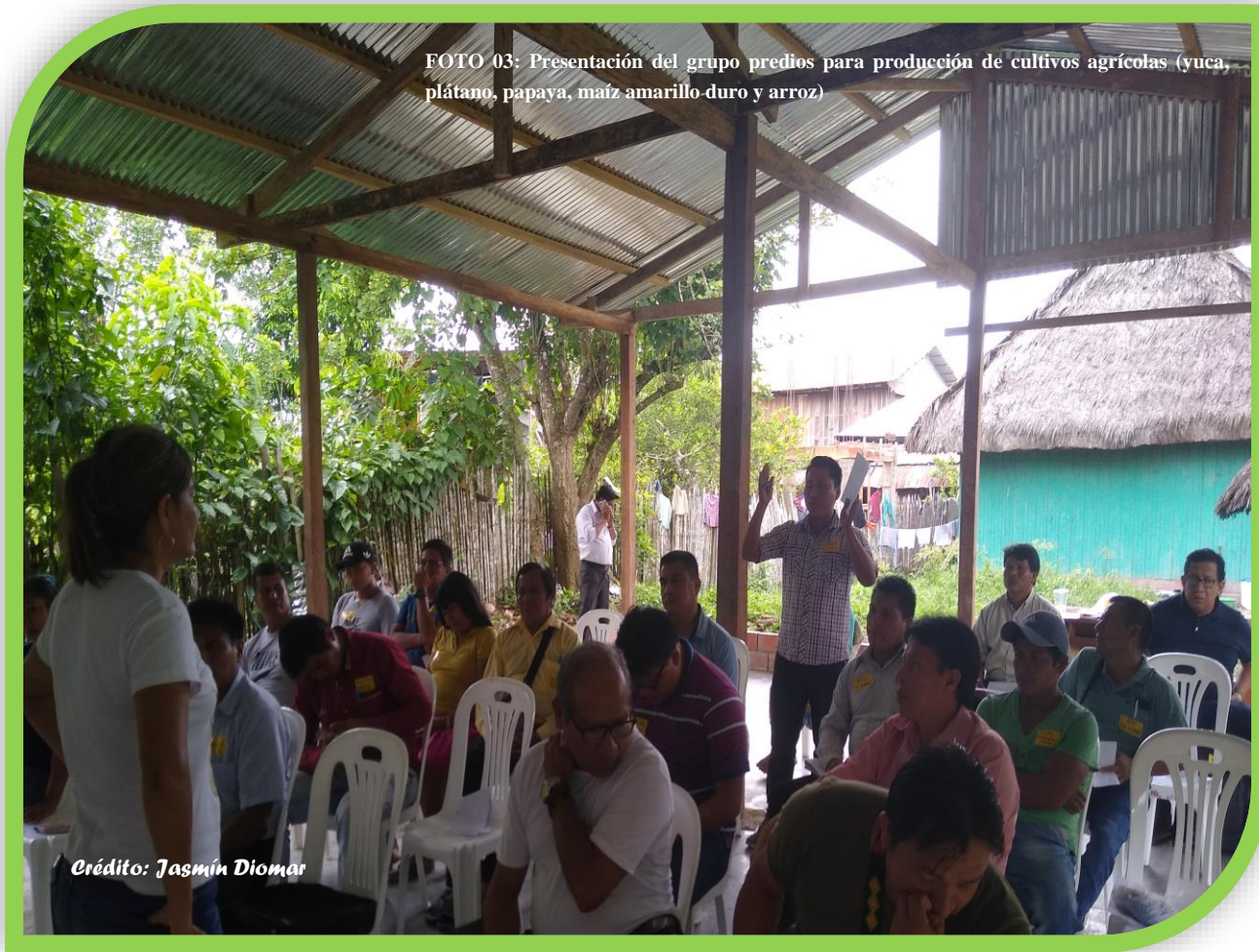
FOTO 03: Presentación del grupo predios para producción de cultivos agrícolas (yuca, plátano, papaya, maíz amarillo-duro y arroz)